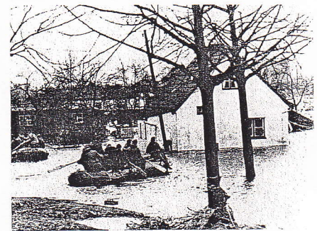
Die große Flut von 1962: Stunde der Bewährung.